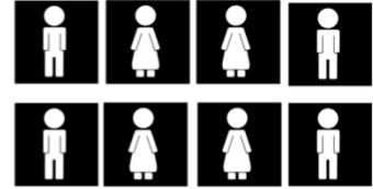
mama's, papa's, oma's, opa's, ooms, tantes