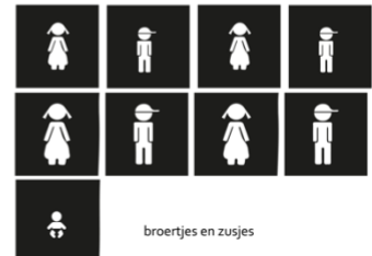
broertjes en zusjes